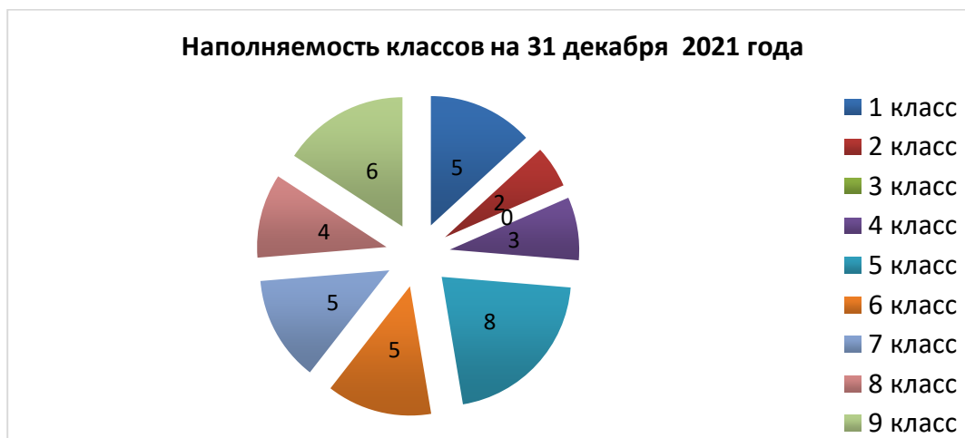
Наполняемость классов на 31 декабря 2021 года

Контингент обучающихся стабилен, движение учащихся происходит по объективным причинам и не вносит дестабилизацию в процесс развития школы.